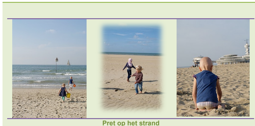
Pret op het strand

Zaterdag hebben we eerst Sea Life bezocht en 's middags hebben we lekker op het strand gezeten.