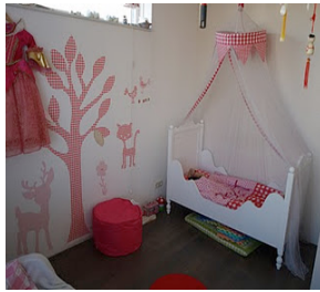
Lizzie's 'oude kamer'.....