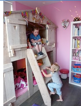
...en tadaa!!! Haar nieuwe kamer....